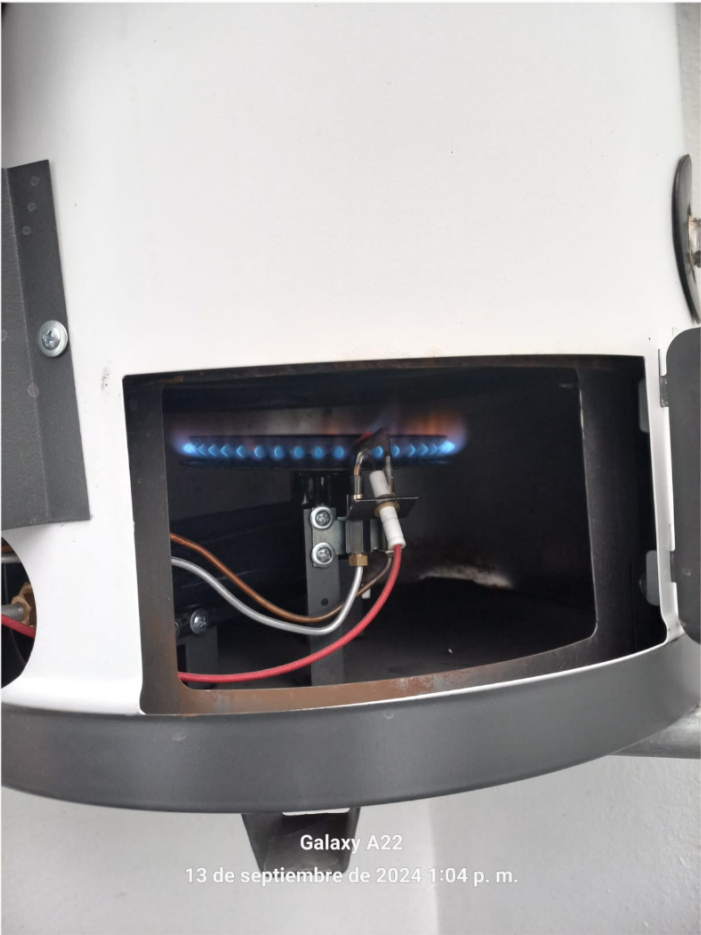
Galaxy A22 13 de septiembre de 2024 1:04 p. m.