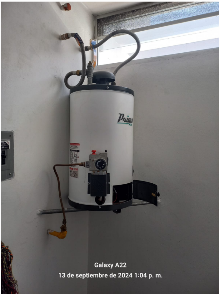
Galaxy A22 13 de septiembre de 2024 1:04 p. m.