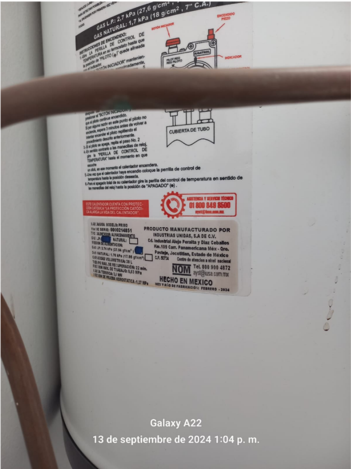
Galaxy A22 13 de septiembre de 2024 1:04 p. m.